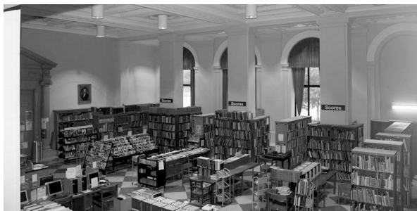
Salle de musique de l'actuelle Free Library de Philadelphie

Jetons un coup d'oeil à la Free Library de Philadelphie telle qu'elle est aujourd'hui :